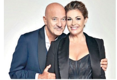
Claudio Bisio e Vanessa Incontrada