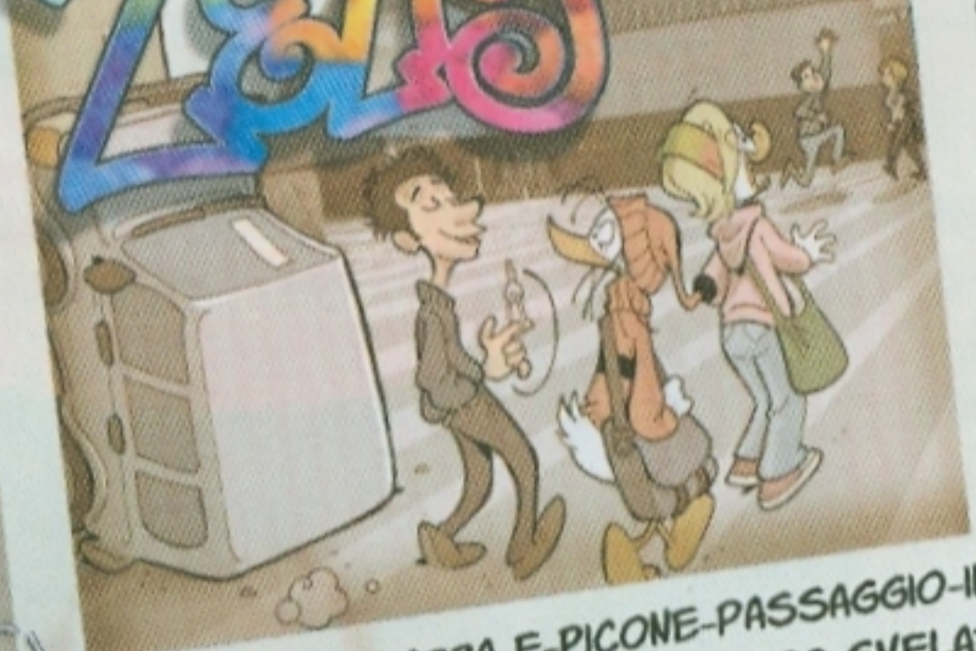
Antefatto: FICARRA-E-PICONE-PASSAGGIO-IN-AUTO-LUOGO-MISTERIOSO-SEGRETO-SVELATO. (VEDI TOPOLINO N. 2880)

Eccoci al Teatro degli Arcimboldi, dove è in programma la conferenza stampa di Zelig!