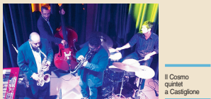
Il Cosmo quintet a Castiglione

Castiglione, il Cosmo Quintet in Concert al Camelliae tea room