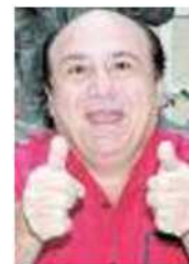
L'isola del cinema e della musica Gerard Butler e Abel Ferrara, attesi a Ischia. A sinistra, Danny De Vito