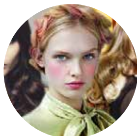
Tendenze: capelli lunghi