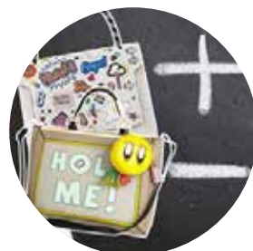
Il più e il meno