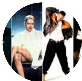
1992, che spettacolo