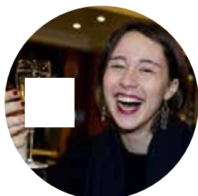
7 gossip dal weekend