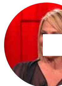
«I talent? Li inventati io»