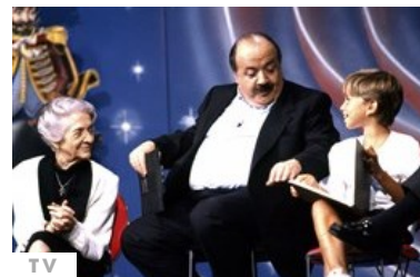
2 giorni fa | di Mario Manca Amici 14: Renato Zero giudice