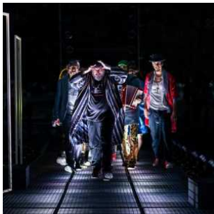
Via della Maddalena, spettacolo da rodare