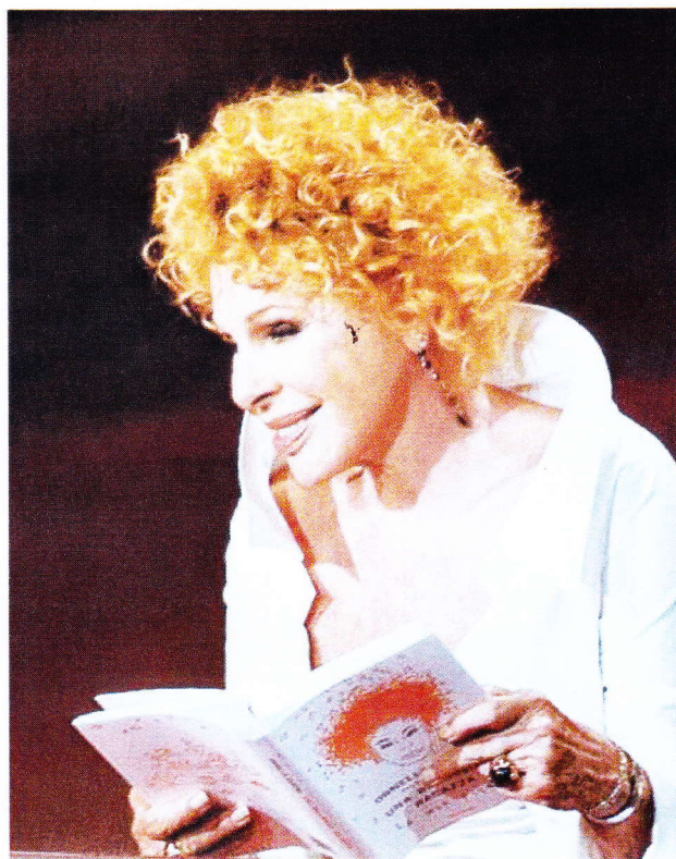
Ornella Vanoni il 7 novembre, con il suo «Ultimo tour»